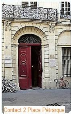
Contact 2 Place Pétrarque

Au sujet de l'acceptation de l'homosexualité ou de la transidentité par la famille